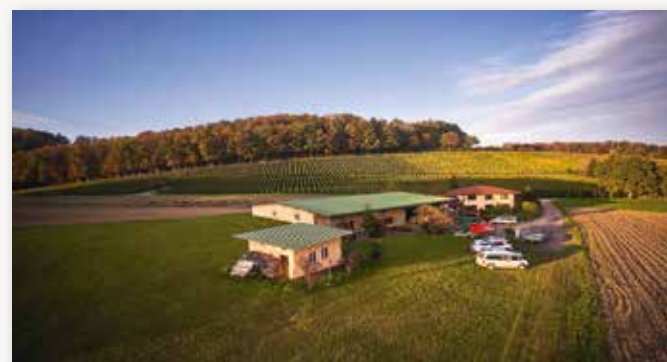
Unser Betrieb in Nack, dahinter der Hausberg mit Reben – die Keimzelle und gute Stube des Weingutes.

Das Weingut Clauß gilt heute als südbadischer Spitzenbetrieb und zählt zu den Best-of der Bodenseeregion. Mit Stolz blicken wir auf eine baden-württembergische Erfolgsgeschichte und arbeiten jeden Tag an deren Fortentwicklung. Die Herausforderungen sind gewaltig. Unsere Zuversicht, diese zu meistern, ebenfalls. Wir wagen die Prognose, daß Sie und unsere Kunden, Freunde und Weinliebhaber noch sehr viele aussergewöhnliche Weine von uns sehen werden. Packen wirs an!