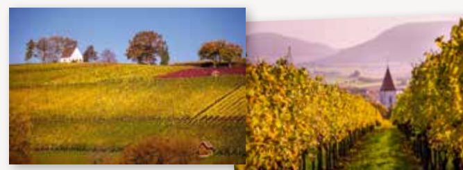
Unsere Premium-Lagen in Erzingen / Klettgau. Links der berühmte Kapellenberg mit lehmigen Kalkböden – Heimat der berühmten BELEMNIT® / URBANUS® Weine.

Mit dem Bau des modernen Anwesens am Fuße der Nacker Reblagen werden nach 2003 alle Aktivitäten am heutigen Standort gebündelt. Es kamen neue Reblagen im Klettgau hinzu, v.a. in Erzingen , deren lehmige Kalkfelsenböden das Nacker Terroir perfekt ergänzen. Vom Erzinger Kapellenberg stammen auch unsere Premiumfüllungen BELEMNIT® und URBANUS® , beides eingetragene Marken und Synonyme für exzellente Burgunder.