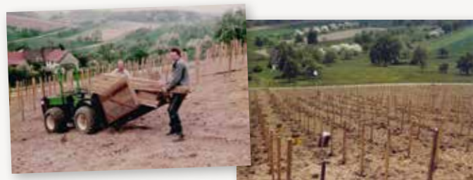
Die erste Rebpflanzung in Nack im Frühjahr 1982.